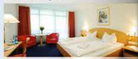
4★Hotel Königshof, Zimmerbeispiel