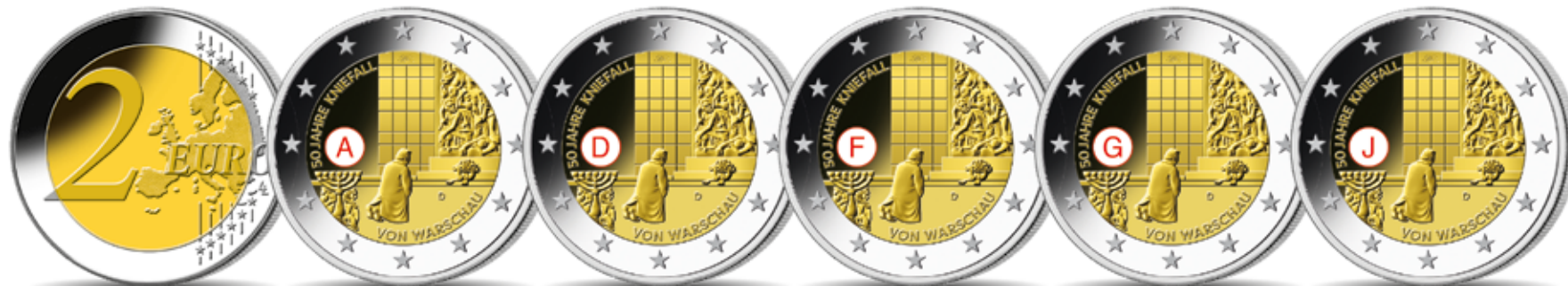
Gemeinsame Rückseite je Ø 25,75 mm