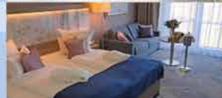
Zimmerbeispiel, 4+ Santé Royale Rügen Resort