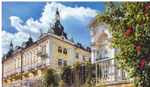
4+ Resort Reitenberger