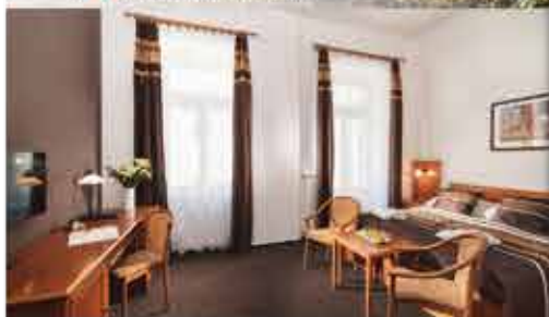
Zimmerbeispiel, 4+ Resort Reitenberger