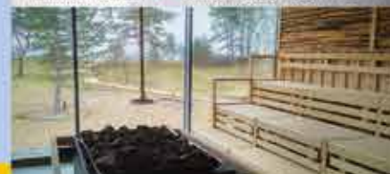
Sauna, 4+ Santé Royale Rügen Resort