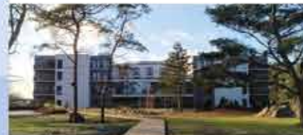
4+ Santé Royale Rügen Resort