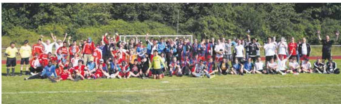
Gruppenfoto mit den Mannschaften der Fußballmeisterschaft der Berufsbildungswerke im Norden.