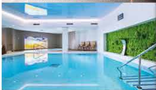
Schwimmbad, 4+ Resort Reitenberger